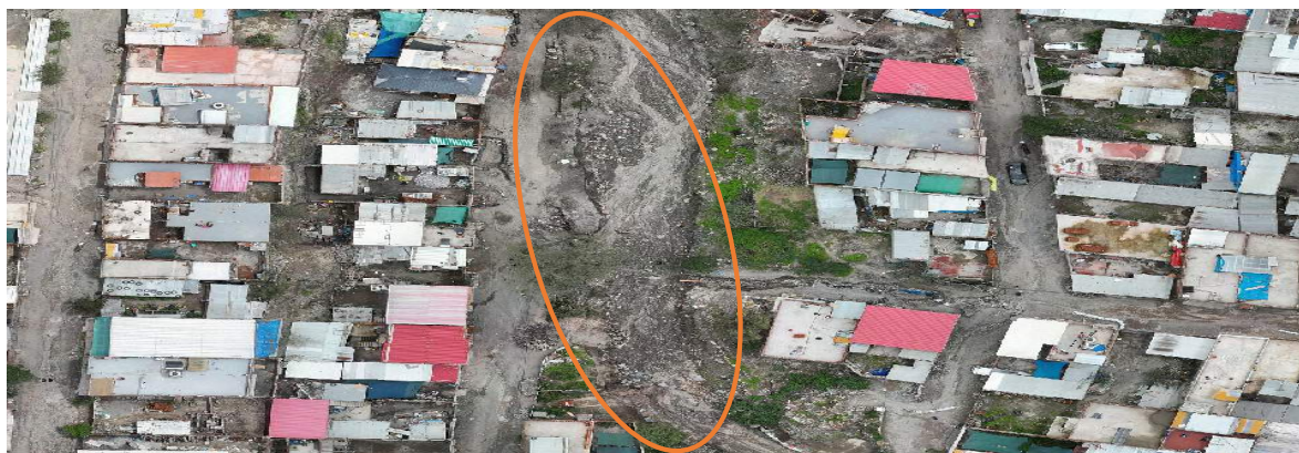
Imagen N° 2. Zona colmatada, en donde se observa sedimentación en el cauce de la quebrada S/N.