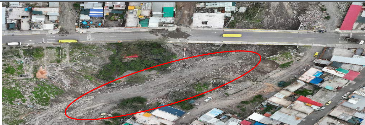
Imagen N° 1. Tramo colmatado en el puente Valdivia, en donde se observa sedimentación en el cauce de la quebrada S/N.